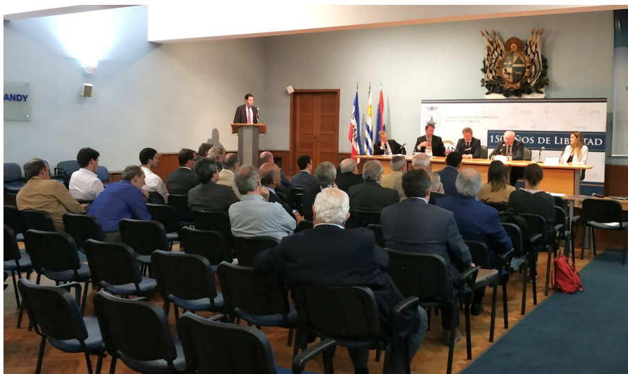
Acto constitutivo de la Cámara Mercantil Uruguay Italia en la Cámara Nacional de Comercio y Servicios 26.11.2018